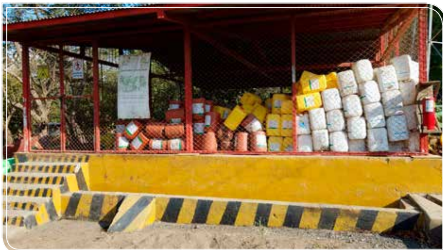
Acopio de envases agroquímicos vacíos en ingenios.

El manejo integral de los desechos sólidos, es una práctica importante dentro del concepto de desarrollo sustentable y sostenible, con ello se reducen los riesgos a la salud y al medio ambiente, por la separación de los desechos desde su origen y por su tipo.