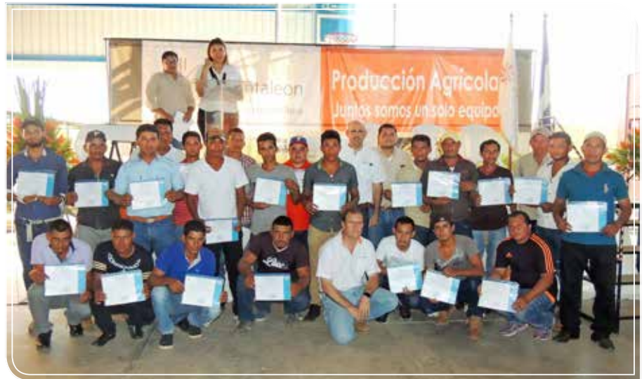
Certificación de Competencias de Producción Agrícola

Este año se graduaron del programa FOM un total de 62 operadores de cosechadoras, tractores, maquinaria pesada y cabezales.