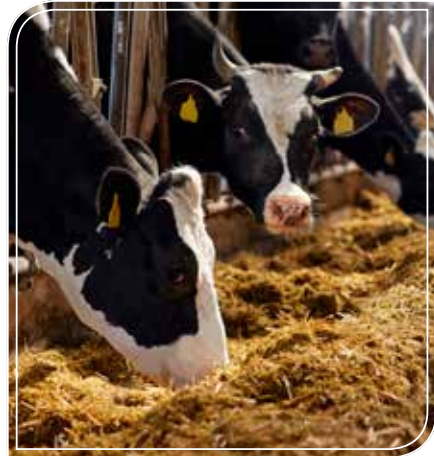
Residuos de cosecha o rastrojos

Residuos de cosecha o rastrojos: son el conjunto de vainas, hojas, cogollos y trozos de caña que quedan dispersos en el campo, una de sus utilidades es para la alimentación animal.