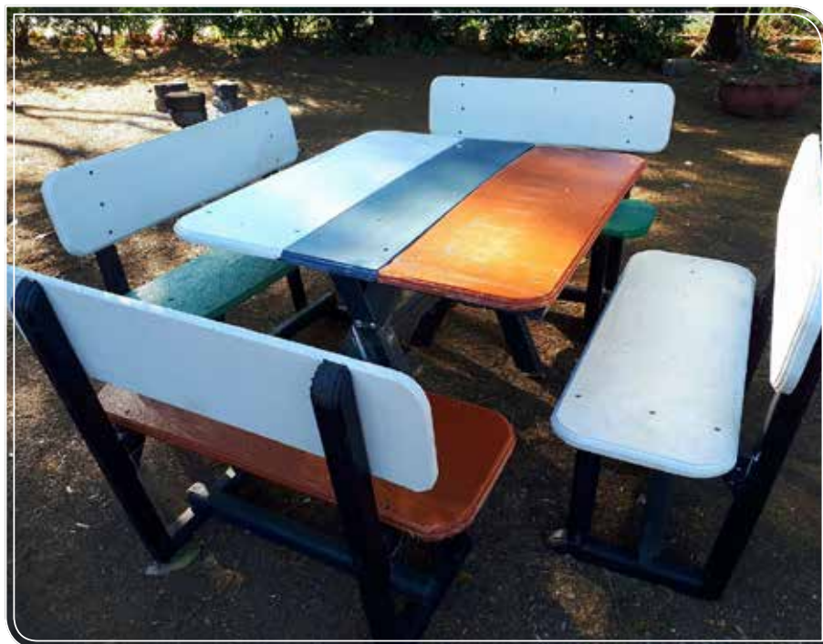
Sillas y mesa producto del reúso de metales.

“ Estamos desmitificando que los ingenios somos contaminadores del medioambiente, porque seguimos trabajando arduamente en muchos proyectos enfocados en conservar el entorno medioambiental, especialmente los cercanos a los ingenios.”