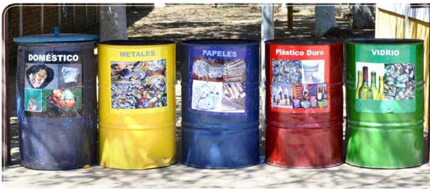
Depósitos para clasificación de desechos

Los ingenios azucareros a nivel mundial, tienen un gran desafío sobre el cuidado y conservación del medioambiente, ya que los residuos y desechos que esta agroindustria genera, tienen gran potencial para ser aprovechados; la adaptación de sus sistemas de producción es primordial para darles el tratamiento adecuado para su aprovechamiento, lo que permite una mayor diversificación.