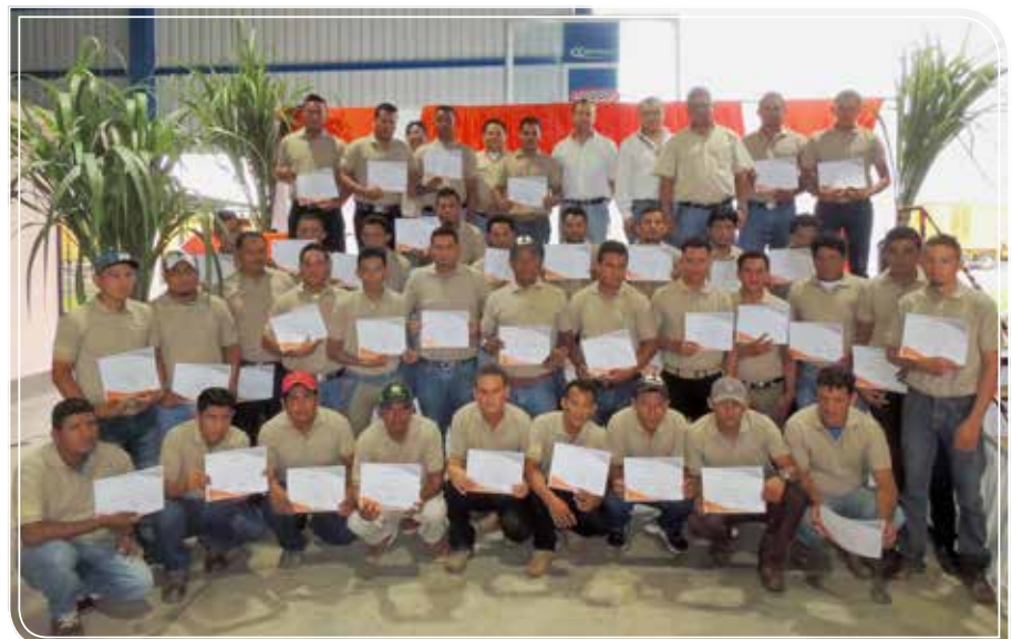
Graduación del Programa Formación de Operadores de Maquinaria

Ingenio Monte Rosa promueve el desarrollo profesional de sus colaboradores y les motiva a comprometerse con la mejora continua.