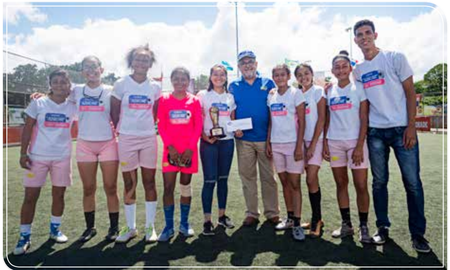
Entrega de premio al equipo Campeón Club Deportivo Napoli

“ Nuestro equipo dio todo dentro del campo de juego y nos sentimos orgullosas de haber quedado como equipo Subcampeón. Para nosotros esta Copa representa una oportunidad de salir de la rutina y evitar caer en los vicios para las jóvenes. ”