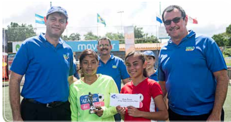
Entrega de premio por Mejor portería

“ Esta final es de los dos equipos que mejor hicieron las cosas, demostrando que el campeonato valió la pena. Para el próximo año esperamos lograr una mayor proyección de las copas que queremos llevar a cabo y llegar a más cantidad de jóvenes. ”