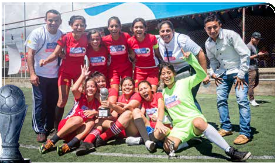
Nuestra Señora de Guadalupe

Con la realización de la Copa "Azúcar" de fútbol, la agroindustria azucarera nicaragüense busca estimular en la juventud el interés de practicar deporte, ya que contribuye a un mejor desarrollo físico y mental, promoviendo con actividades de sana competencia la disciplina, responsabilidad y el trabajo en equipo; así como la permanencia escolar para forjarse un mejor futuro.