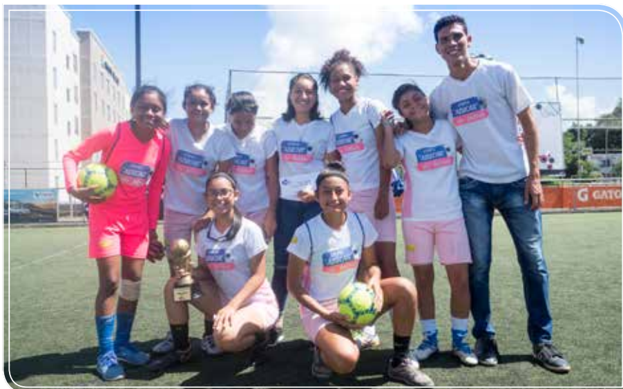
Club Deportivo Napoli

“ Como jugadoras hicieron un excelente esfuerzo, por el compromiso de poner en alto los nombres de sus equipos; además de trabajar como compañeras. Muchas felicidades por esa entrega. ”