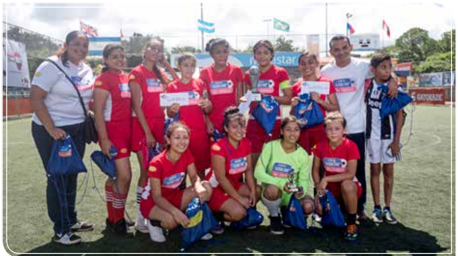
Equipo Subcampeón Nuestra Señora de Guadalupe con su respectivo premio.